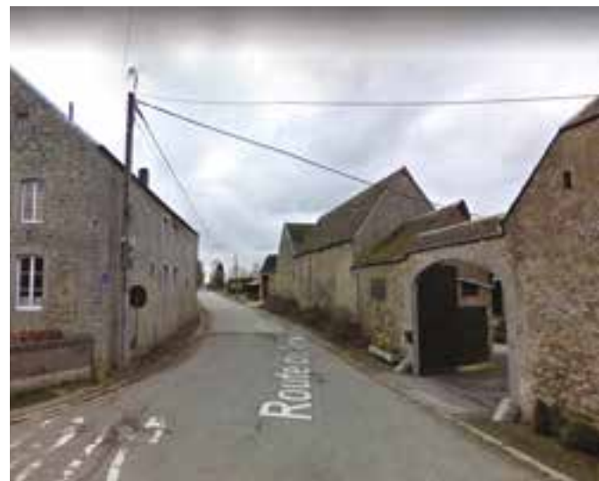
Plan d'Investissement Communal 2019-2021 : réfection de la rue de Terwagne à Seny