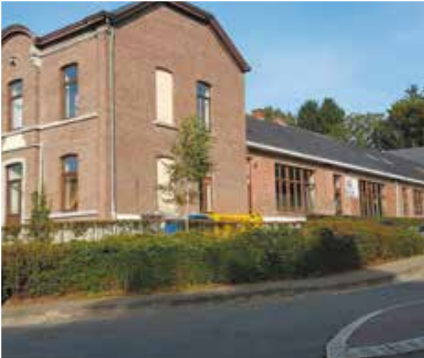
Nettoyage et préparation de l'école pour la rentrée