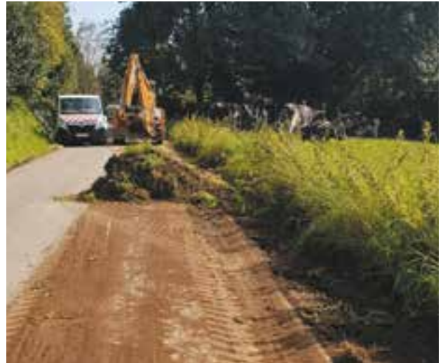
Nettoyage des filets d'eau à Fraiture