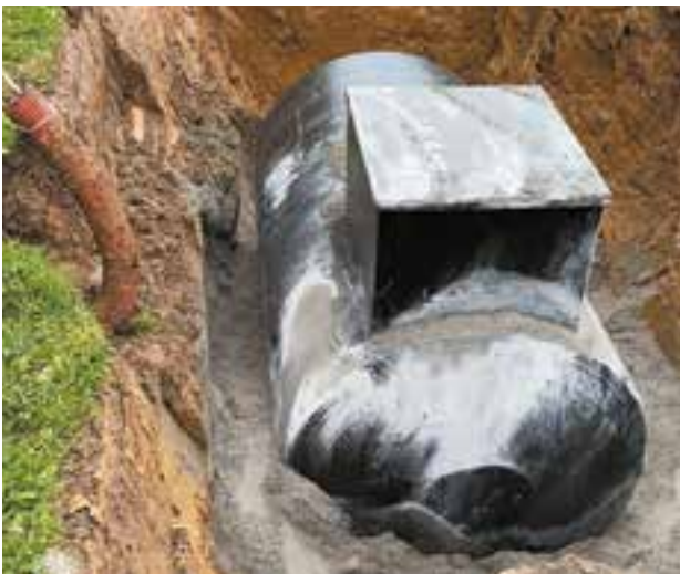
Remplacement de la citerne à mazout de la tinlotoise