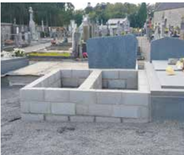
Création de nouvelles concessions au cimetière de Tinlot