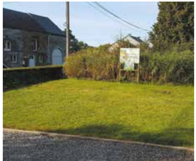
Taille des haies et entretien des espaces verts