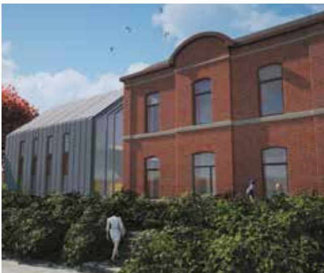
Plan futur extension de l'école communale

En effet, ces travaux estimés à 742 000€ TVAC, excepté la garderie, pourraient bénéficier de l'intervention du Programme Prioritaire des Travaux 2019-2020 à concurrence de 80 % et le solde bénéficierait de l'intervention du Fonds des bâtiments scolaires à concurrence de 60 %. La partie non subsidiée serait en prélèvement sur fonds propres ou par emprunt.