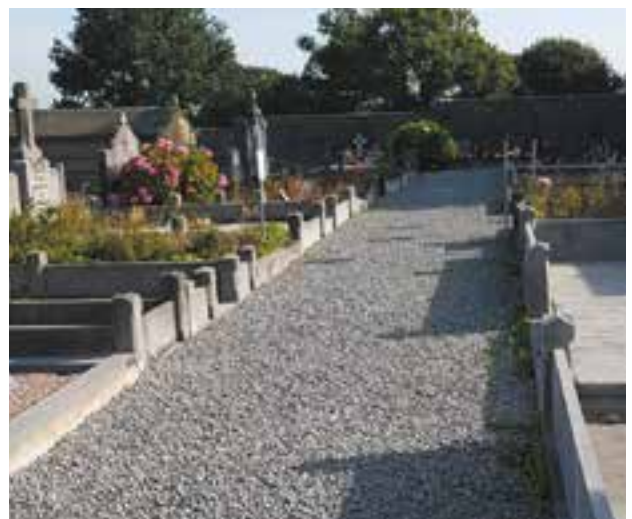
Travaux d'entretien des cimetières zéro phyto